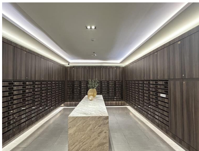
รูปที่ 1.6-1 แสดงสถานภาพปัจจุบันของโครงการ (ช่วงเดือนกรกฎาคม – ธันวาคม 2568)